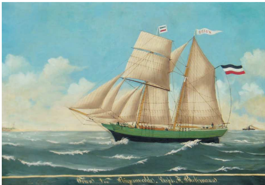
Tabl. II: A. „Orion” – płótno, olej, własność: Zamek Książąt Pomorskich Muzeum w Darłowie, nr kat MD AH 560.