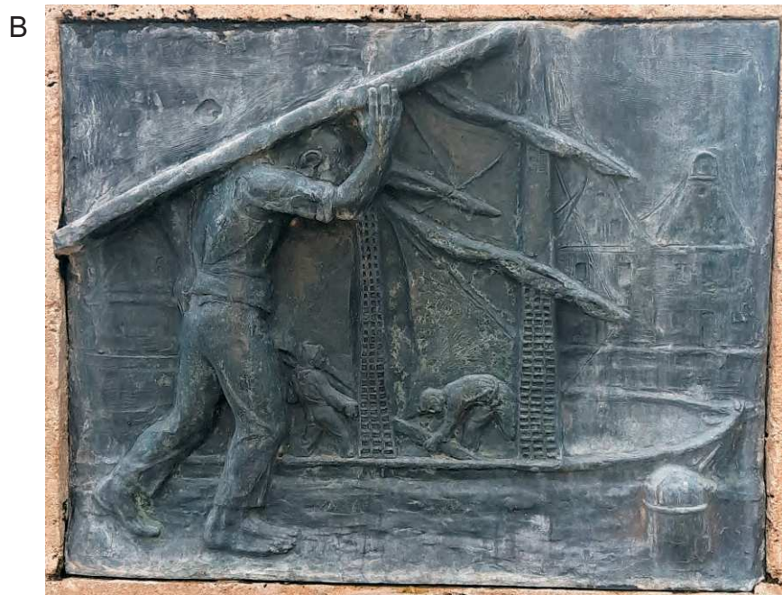
Tabl. IV: A, B. Darłowo, fontanna. Plakiety obrazujące historię miasta od czasów drugiej lokacji po czasy współczesne Hemptenmacherom. Fot. K. Kontowski 2020 rok