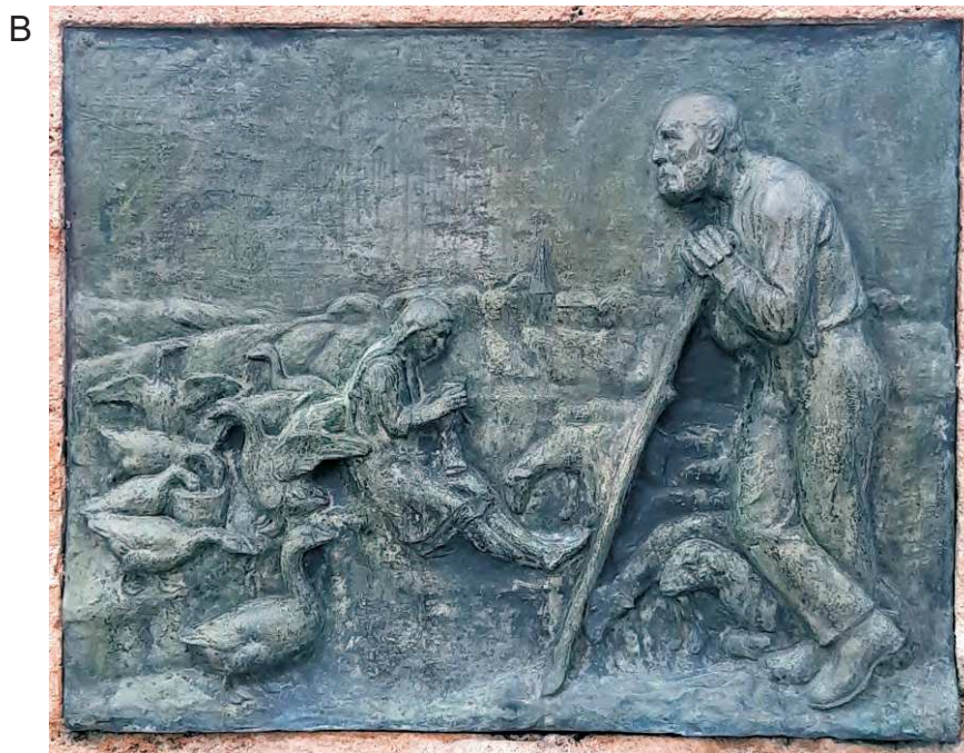
Tabl. III: A, B. Darlowo, Fontanna. Plakiety obrazujące historię miasta od czasów drugiej lokacji po czasy współczesne Hemptenmacherom. 2020 rok