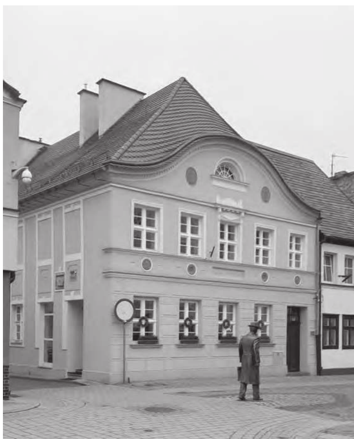
Ryc. 8. Darłowo, kamienica Hemptenmacherów po remoncie przeprowadzonym w latach 2014–2018.