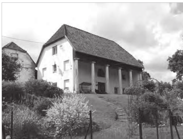
Ryc. 3. Bronowo, lamus (dom kolumnowy)