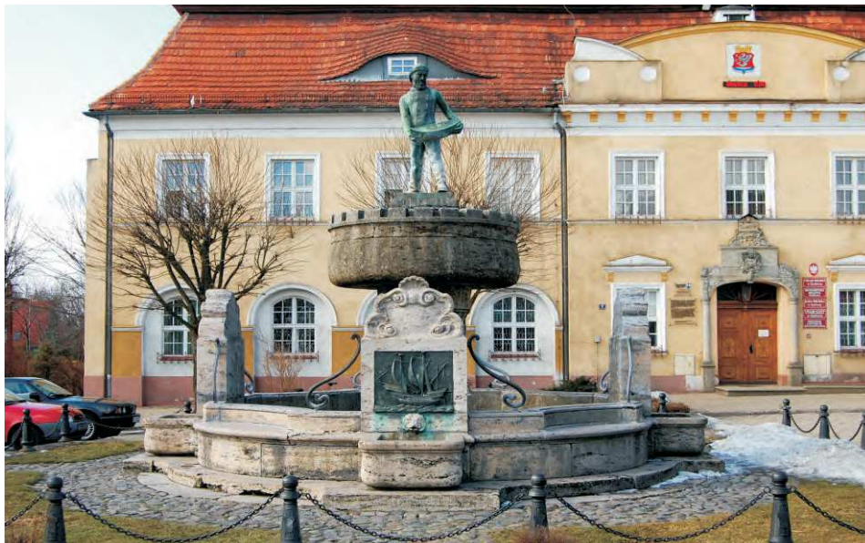
Tabl. I: A. Darłowo, fontanna – widok od strony wschodniej. Fot. K. Kontowski, 2013 rok