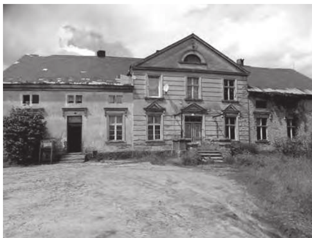
Ryc. 2. Bronowo, dwór klasycystyczny