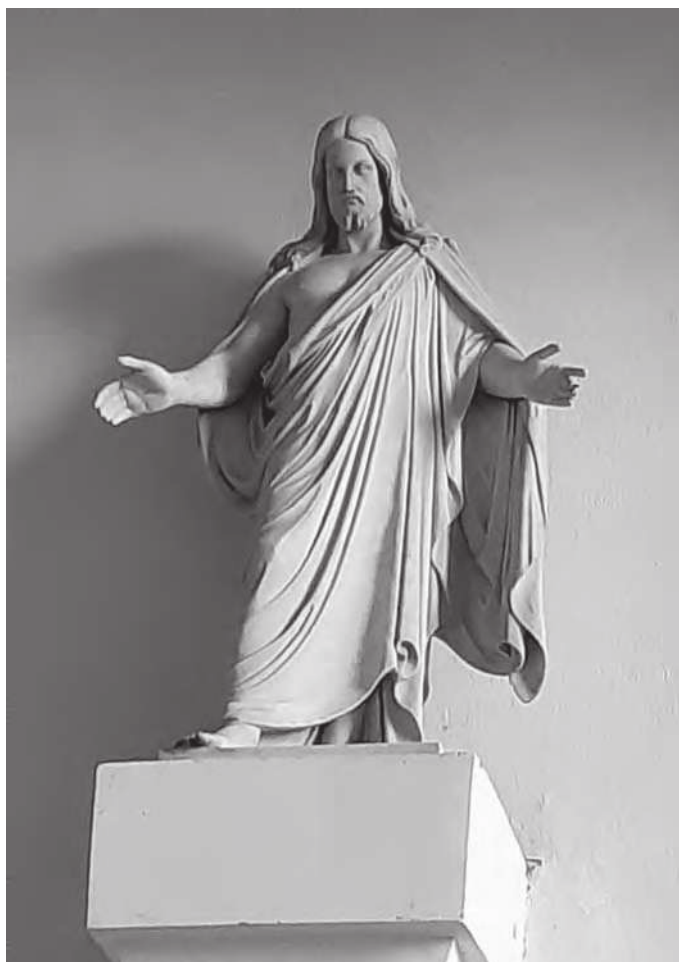
Ryc. 7. Figura Chrystusa z kościoła mariackiego.

Jedną z największych darowizn dla miasta, a jednocześnie pomnikiem upamiętniającym rodzinę Hemptenmacherów, była fontanna zwana potocznie „Fontanną rybaka”. Wykonał ją w latach 1919–1920 Wilhelm Gross, artysta pochodzący ze Sławna 18 . Jest to wolnostojąca forma przestrzenna o neobarokowej stylistyce, usytuowana w zachodniej części dar-