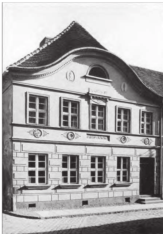
Ryc. 1. Darłowo, kamienica Hemptenmacherów, fasada, pierwsze ćwierć XX wieku (Rosenow 1989: 692)

została dobudowana oficyna. Za kamienicą mieściły się plac, obiekty gospodarcze i magazynowe, które w następnych latach XIX wieku ulegały redukcji i przekształceniom. Na ich miejscu powstawały kolejne oficyny (Kowalczyk-Kontowska 2013).