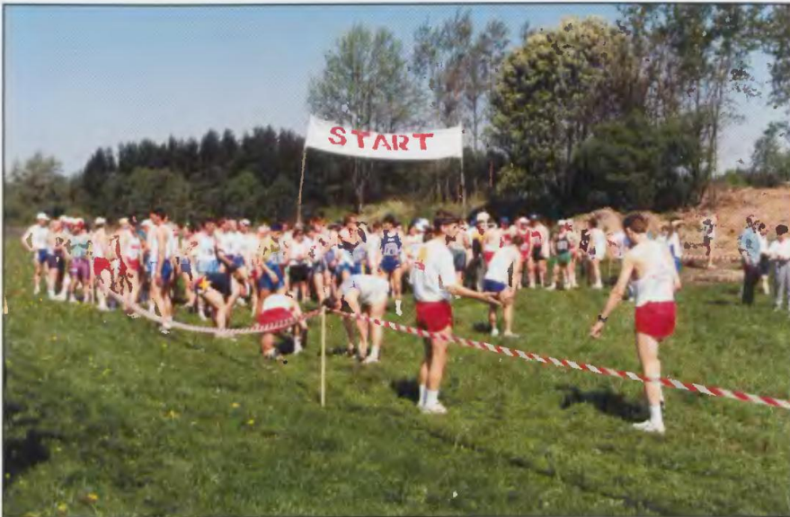
B. Start do Biegu Święców przy grodzisku wczesnośredniowiecznym we Wrzeźnicy, gm. Sławno.