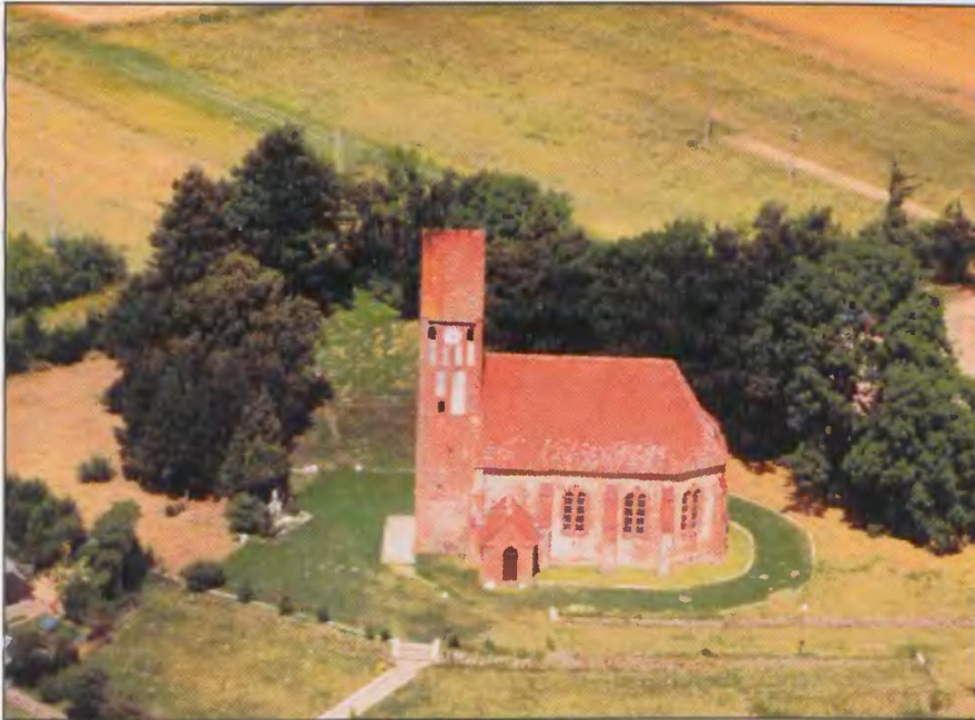
A. Sławsko, gm. Sławno. Gotycki kościół p.w. św. Piotra i Pawła - najcenniejszy zabytek architektury sakralnej na terenie gminy Sławno.