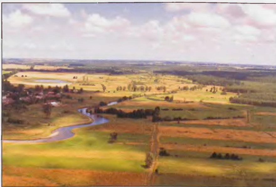
B. Dolina Wieprza w rejonie projektowanego Parku przyrodniczo-archeologicznego "Wrześnickie Kurhany".