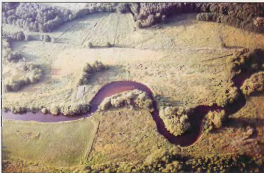
A. Rzeka Wieprza stanowi znakomity szlak kajakowy i oferuje wiele niezapomnianych wrażeń.