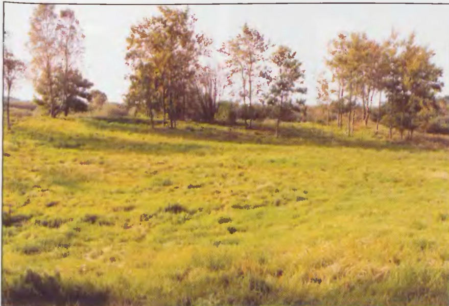
A. Wrzeńska, gm. Sławno. Uprządkowany i zadbane majdan grodziska wczesnośrednio-wiecznego podnosi walory estetyczne całego obiektu.